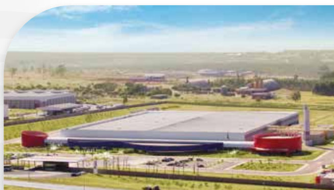
Unidade Fabril em Brasília - DF

Parcerias com instituições públicas e privadas: Instituto Butantã, PUC-RS e UFMG