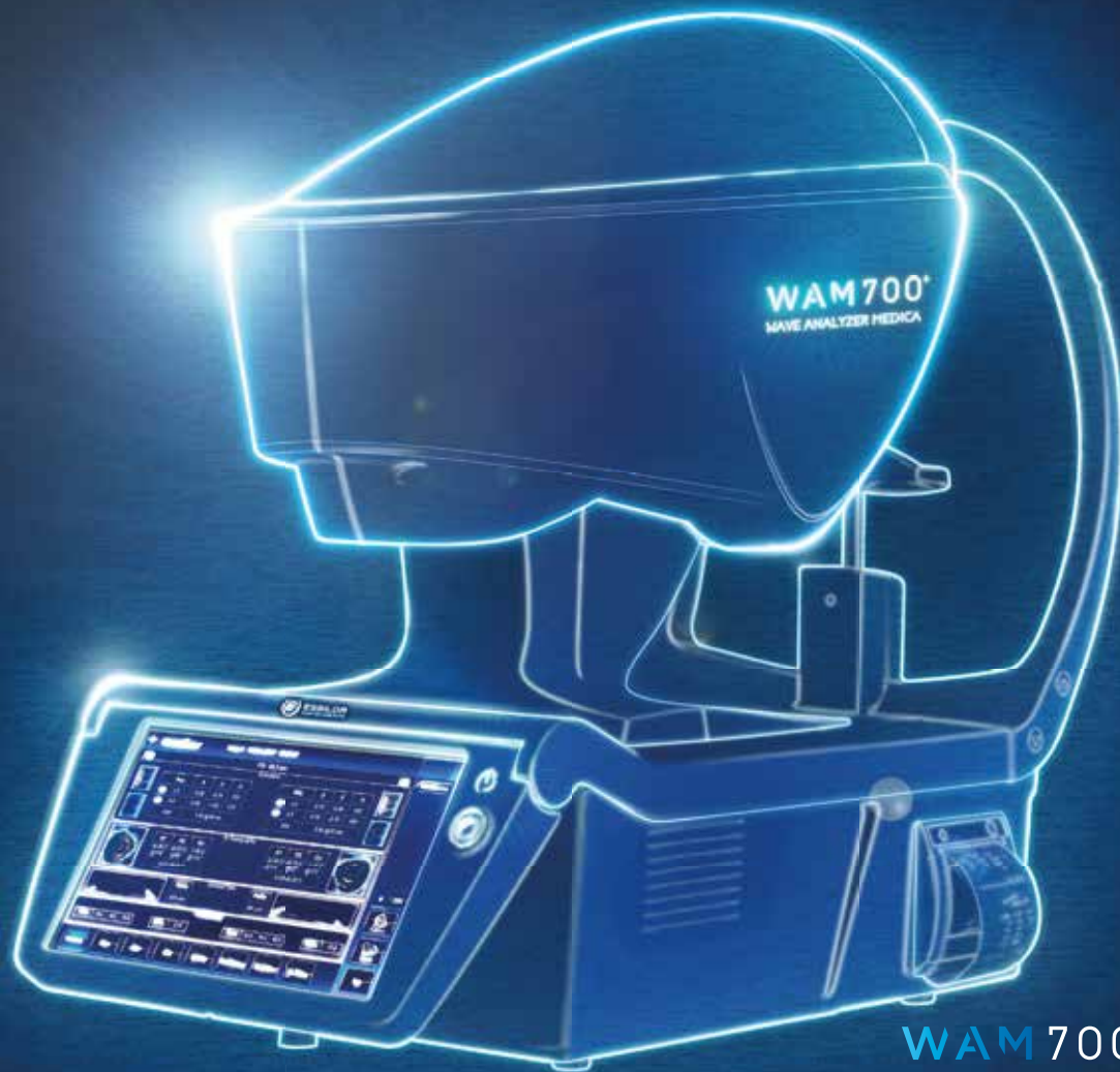
WAM 700 + WAVE ANALYZER MEDICA